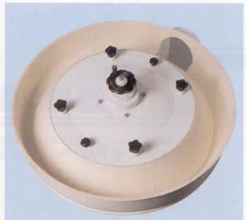
Campana con movimento planetario regulable a piacimento Adjustable bell with planetary rotary motion Cloche avec mouvement rotatoire planétaire réglable à discrétion Einstellbare Haube mit Umlaufbewegung Campana con movimiento rotatorio planetario regulable a placer

Particularmente indicada para 1500 redondear panecillos de un